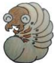
ようちゆう 幼虫を