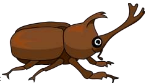
かぶとむしに育てよう！